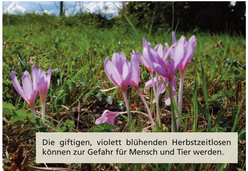
Die giftigen, violett blühenden Herbstzeitlosen können zur Gefahr für Mensch und Tier werden.

Grundlegend gilt: Schnittgut, das Herbstzeitlose enthält, darf wegen seiner Giftigkeit, weder als Futter verwendet