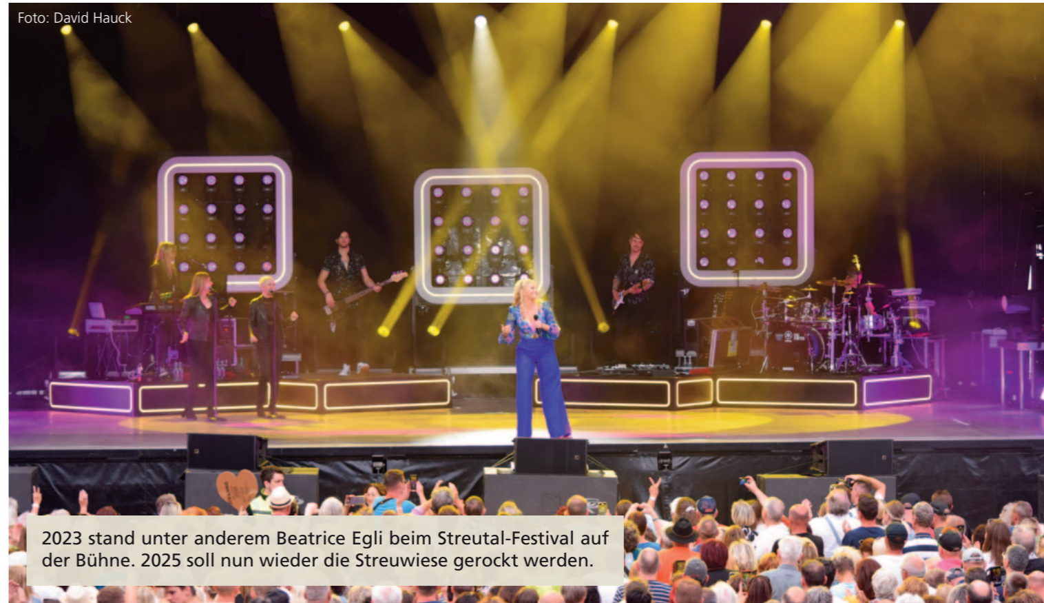
2023 stand unter anderem Beatrice Egli beim Streutal-Festival auf der Bühne. 2025 soll nun wieder die Streuwiese gerockt werden.